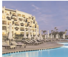
Steigenberger: 4-Nächte im Al Dau Beach in Hurghada