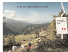
Österreich Werbung: Erlebnisureiselauf in Kärnten.