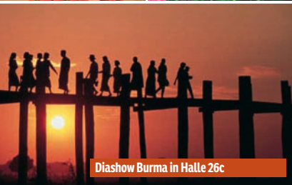
Diashow Burma in Halle 26c