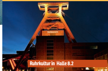
Ruhrkultur in Halle 8.2

Das gab es noch nie: Zum ersten Mal ist eine deutsche Region Partner "Land" der ITB! Das Ruhrgebiet mit seiner einzigartigen Industriekultur präsentiert sich zum einen als Kulturhauptstadt Europas 2010, zum anderen als spannende Urlaubsregion, die auch 2009 schon zum Reisen und Entdecken einlädt. Das vielfältige Urlaubsangebot reicht von anspruchsvollem Entertainment und hochkarätigen Museen bis zu idyllischen Radtouren entlang der grünen Adern des gewachsenen Ballungsraums. Festivals werden auf der ITB genauso präsentiert wie Unterkunftsmöglichkeiten. Kommen Sie vorbei und erleben Sie die neue Metropole Ruhr in Halle 8.2 am Stand 101.