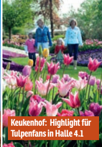
Keukenhof: Highlight für Tulpenfans in Halle 4.1