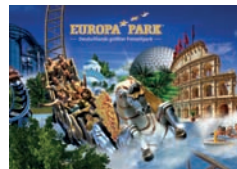
Europapark Rust: 2 Tage Familienspaß im Übernachtung