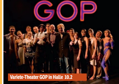
Variete-Theater GOP in Halle 10.2

Tulpen im Keukenhof Der Keukenhof bringt die ITB Berlin zum blühen. Gewinnen Sie Ihre Eintrittskarte zum meistfotografierten Ort der