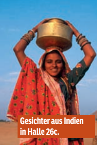
Gesichter aus Indien in Halle 26c.