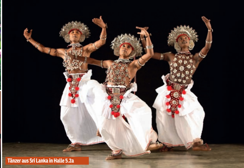
Tänzer aus Sri Lanka in Halle 5.2a