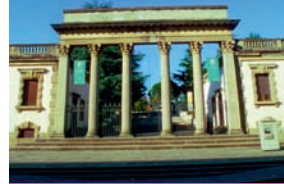
Italienische Zentrale für Tourismus: 1 Woche Italien.