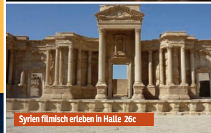
Syrien filmisch erleben in Halle 26c

Niederlande, oder nehmen Sie am ITB-Sonntag eine von 6.000 holländischen Tulpen mit nach Hause. Halle 4.1