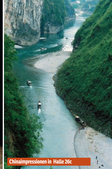
Chinaimpressionen in Halle 26c

Witziges Fotoshooting Lassen Sie sich vor besonderen Sehenswürdigkeiten des Saarlandes fotografieren und versenden Sie Ihre persönliche, vor Ort fotografierte und gedruckte Postkarte an Ihre lieben Daheimgebliebenen. Halle 8.2